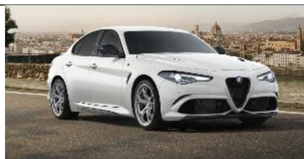
248 – Bianco Trofeo Tristrato