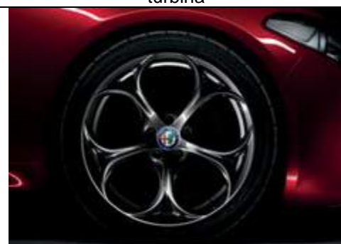
3CV – jante din aliaj de 19" brunate cu 5 orificii