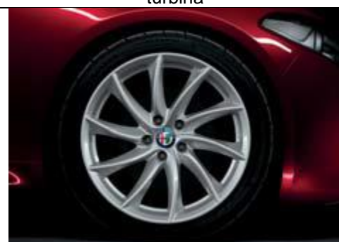
3CO - jante din aliaj de 18" cu design turbina