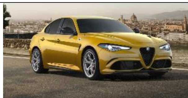
437 – Junior GT Ocra