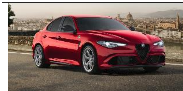
465 – Rosso GTA