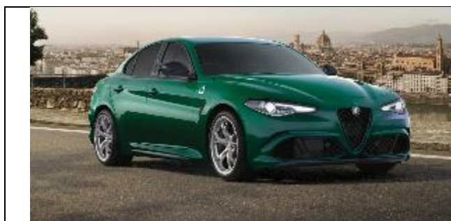
646 – Verde Montreal Tristrato