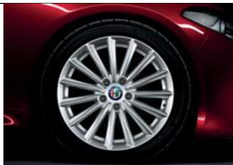
1MH - jante din aliaj de 17" cu design turbina