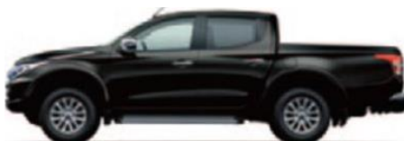
Black Mica (X08)