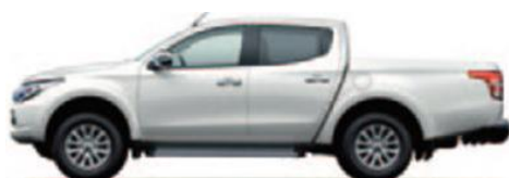
White Pearl (W54)