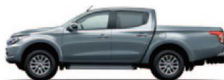
Titanium Gray Metallic (U17)